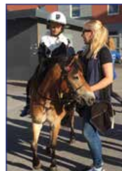
Ponnyridning på publikplats