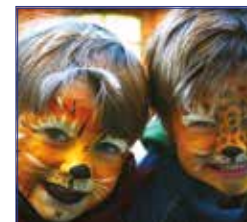
Ansiktsmålning i tothallen