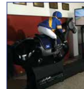
Monté Python i tothallen