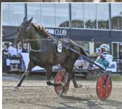
Admiral As.

V5® förslag (lopp 7-11) 4 x 6 x 4 x 4 x 1 Rader 384 Kostnad 384 kr